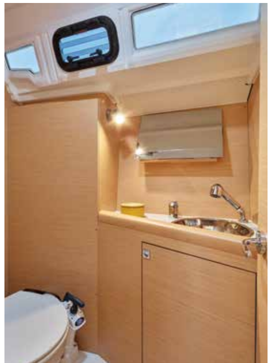
▲ Ventilated and bright head Salle de bain aérée et lumineuse Belüftetes und helles Badezimmer Ventilado y luminoso cuarto de baño Bagno aerato e luminoso