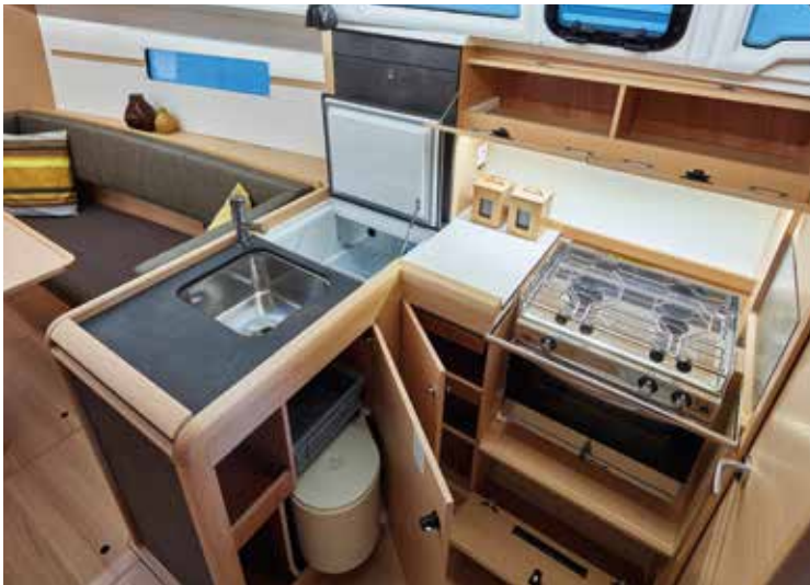
▲ Well-equipped kitchen for cruising Cuisine bien équipée pour la croisière Gut ausgestattete Küche für die Kreuzfahrt Cocina bien equipada para navegar Cucina ben attrezzata per la crociera