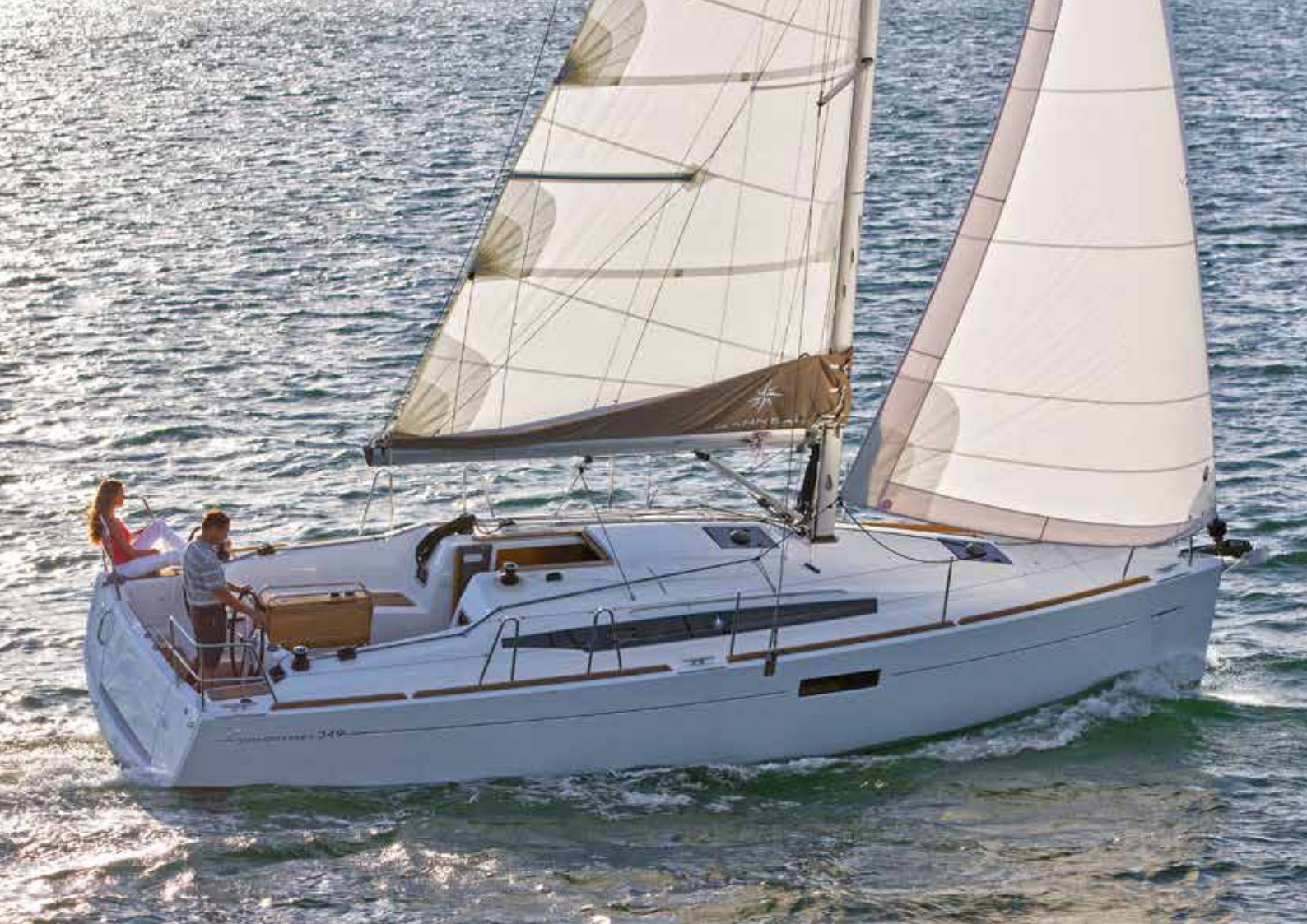
▲ Modern design Design moderne Modernes Design Diseño moderno Design moderno