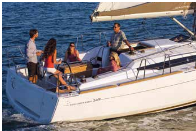
◀ Double steering wheel Double barres à roue Doppel Lenkrad Doble Timón de Ruedas Doppia ruota del timone