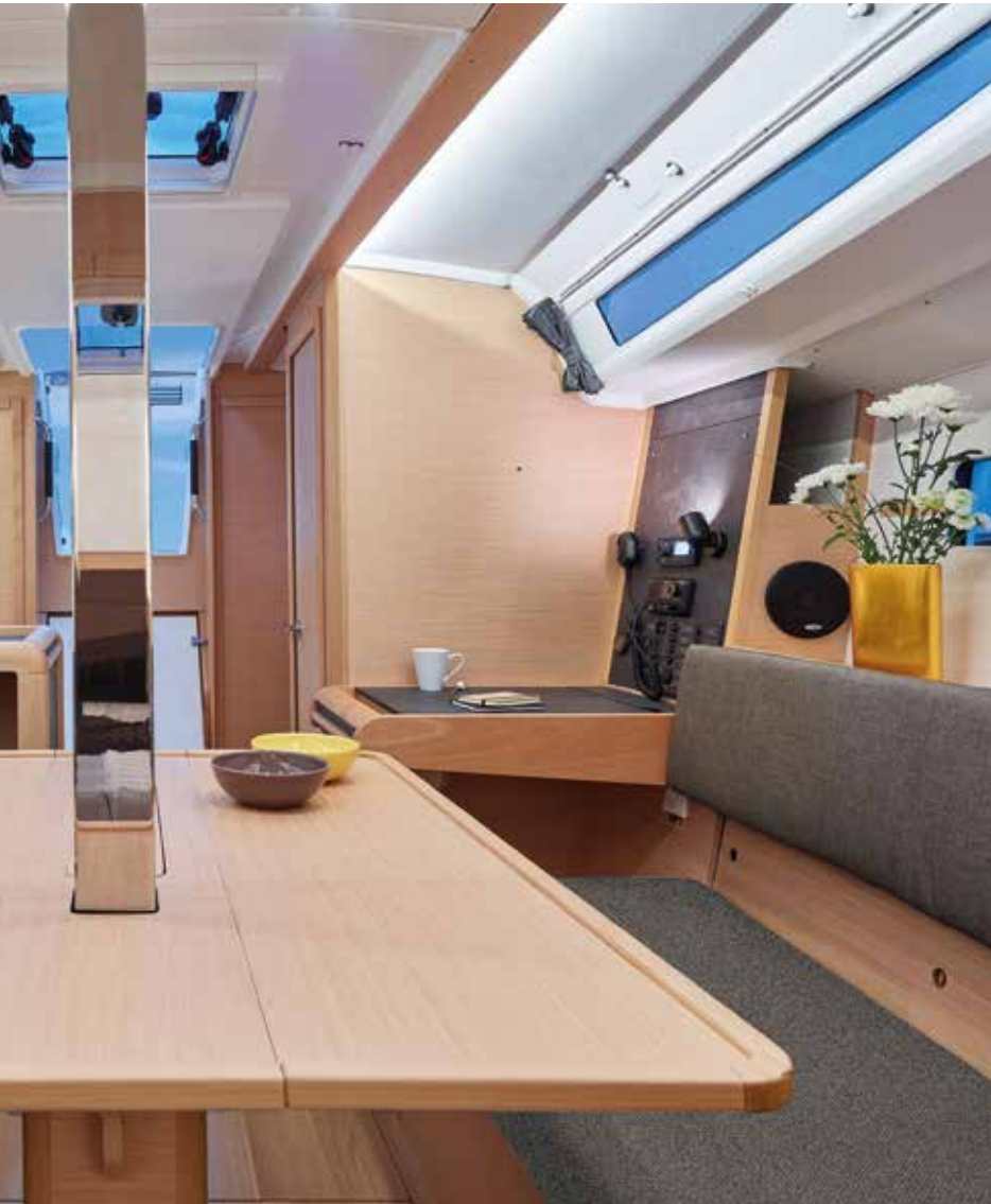
▲ Cozy saloon Carré convivial Gemütlicher Salon Salón acogedor Salotto accogliente