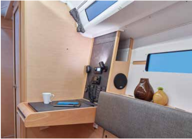
◀ Functional Chart table Table à carte fonctionnelle Funktionskartentisch Mesa de cartas funcional Tavolo da carteggio funzionale